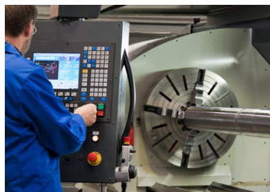
© Gina Sanders / Fotolia #18964313

Über die Maschinenversicherung können alle stationären, maschinellen und elektrischen Einrichtungen und sonstige technische Anlagen versichert werden. z.B. Kessel, Motoren, Turbinen, Generatoren, Bohr-, Dreh- und Fräsmaschinen, Druck- und Falzmaschinen, Aufzüge, Hallenkräne, Förderanlagen, Sämaschinen, Mährescher, Strohpressen u.v.m.